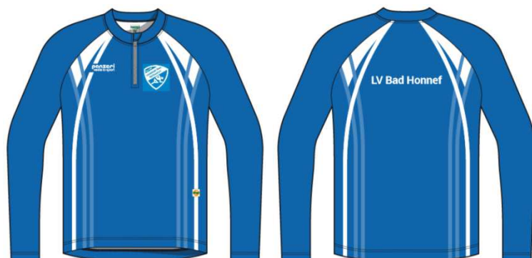
(K) Trikot Langarm Jack Coolmax Winter Stretch