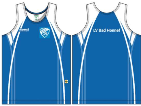
(A) Träger Herren Light Coolmax