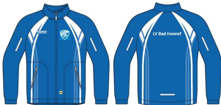
(J) Winterjacke ohne Kapuze Windtex