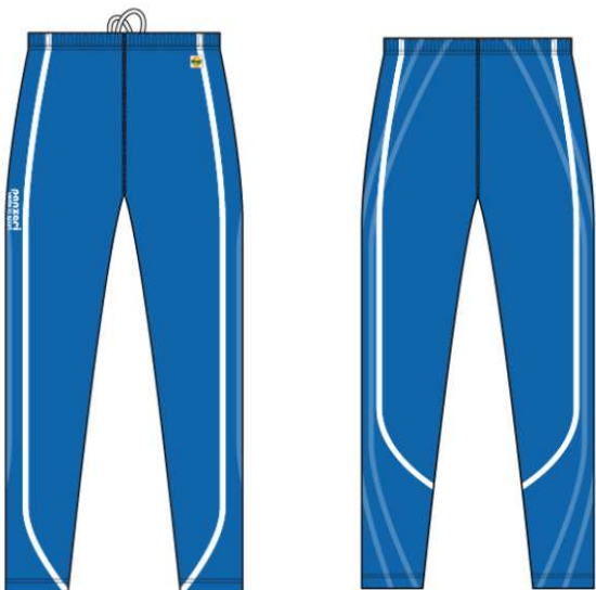
(T) Leggings Stretch Power Winter Stretch