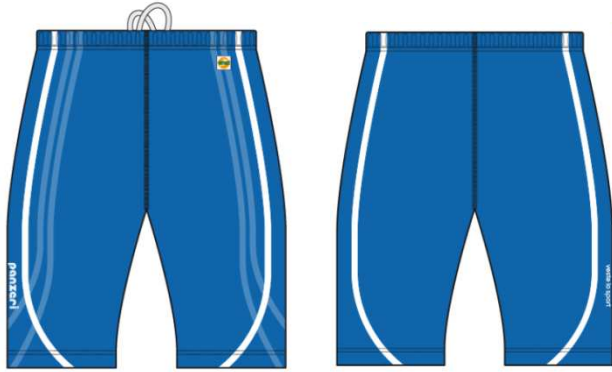
(H) Short tights Stretch Power