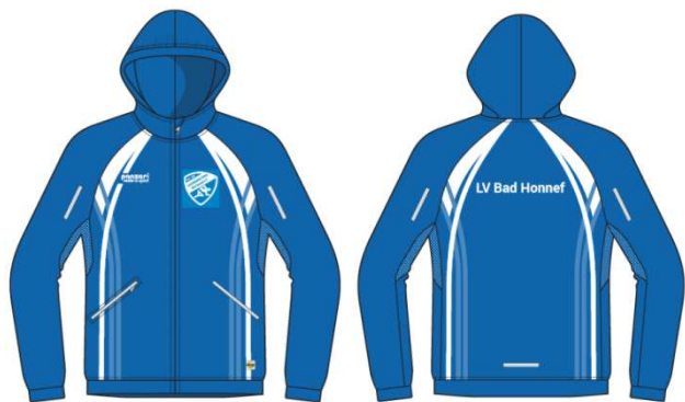
(V) Windjacke ohne Kapuze WindteXlight