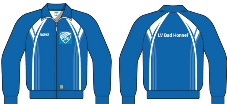
(ZJ) Trainingsjacke Filanca