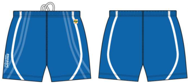
(F) Hot Pants Stretch Power