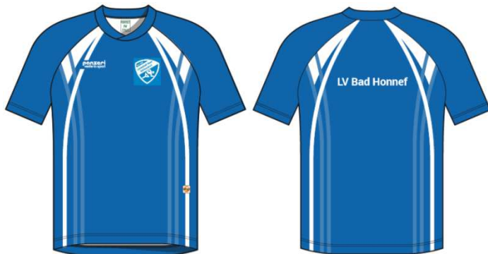
(P) Trikot Kurzarm (Abb.) Jack Coolmax