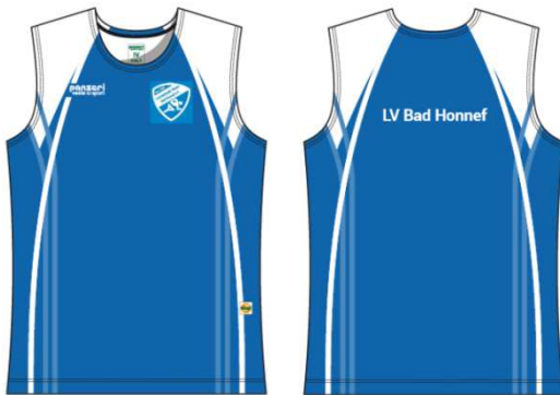
(O) Tank Top Light Coolmax