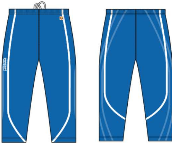
(U) \frac{3}{4} Tights Stretch Power