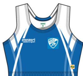
(X) Top Damen x-back Stretch Power