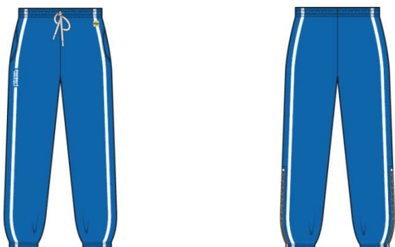
(ZO) Jogginghose Filanca