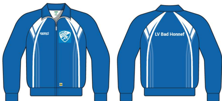
(ZJ) Trainingsjacke Filanca