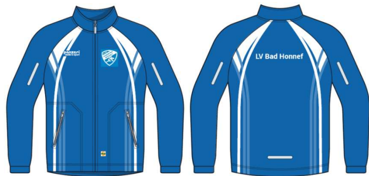
(J) Winterjacke ohne Kapuze 100,00€ Windtex