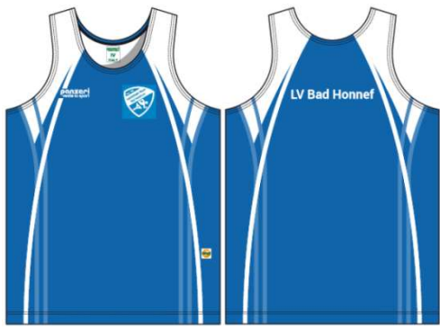
(A) Träger Herren Light Coolmax