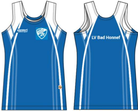
(NM) Träger Herren tights X-Fit Stretch Power