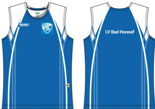
(O) Tank Top Light Coolmax