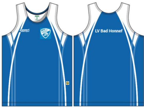
(AM) Träger Herren Light Coolmax